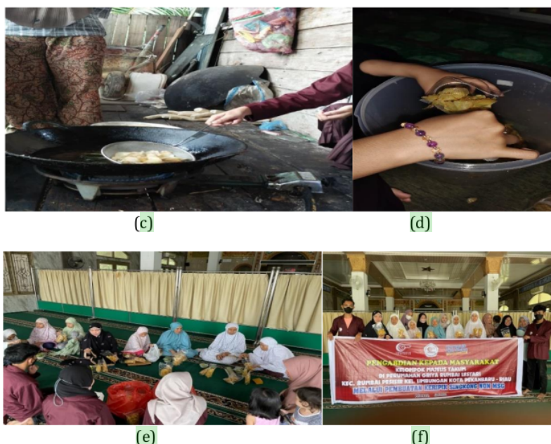
Gambar 1. (a) Kegiatan Pembuatan Keripik Singkong Non MSG (b) Perendaman keripik singkong dengan Kunyit (c) Proses Penggorengan Keripik Singkong (d) Proses Pengemasan (e) Penjelasan Proses Pembuatan Keripik Singkong Non MSG (f) Foto Bersama